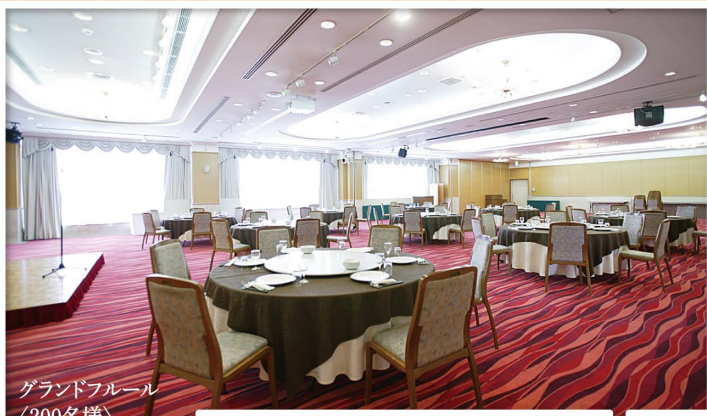
グランドフルール (200名様)