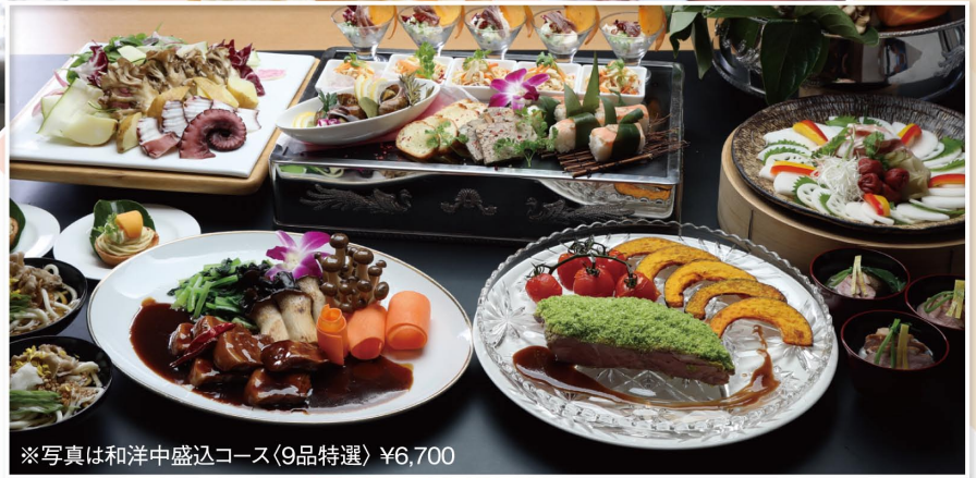
※写真は和洋中盛込コース(9品特選) ¥6,700