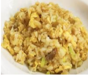
じゃこ梅 チャーハン